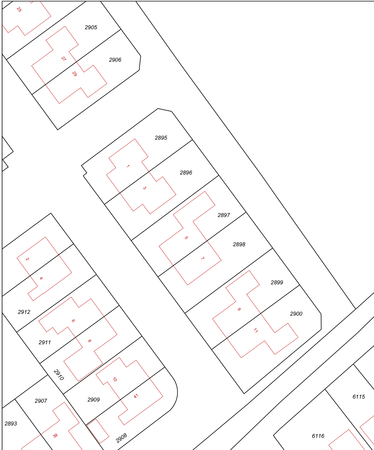
Uittreksel Kadastrale Kaart